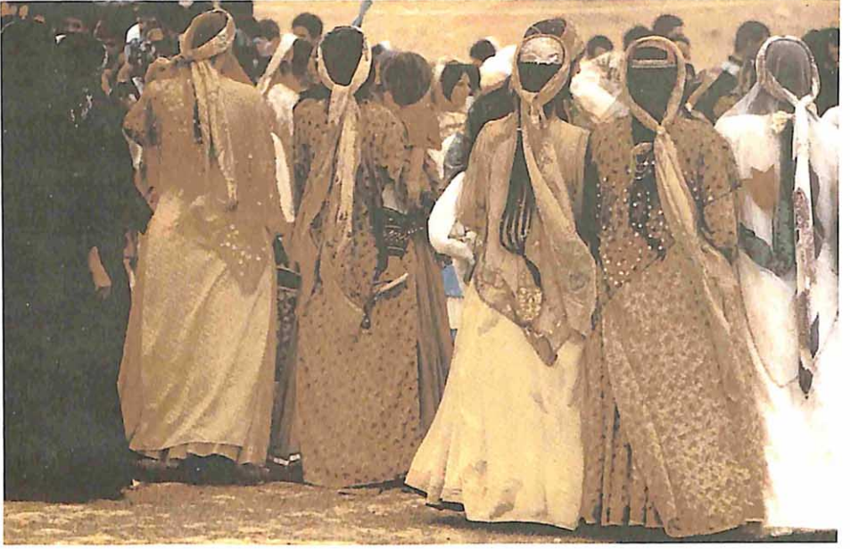
Çille töreninde kil(zılgıt) çeken gençler